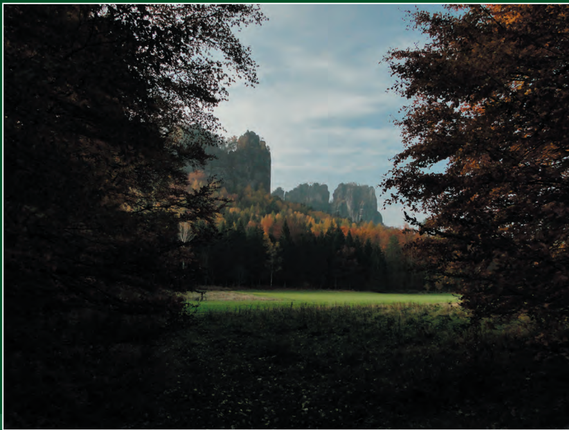
Daniel Tietz, Dresden: Geheime Steine (Schrammsteinwiese Sächsische Schweiz)