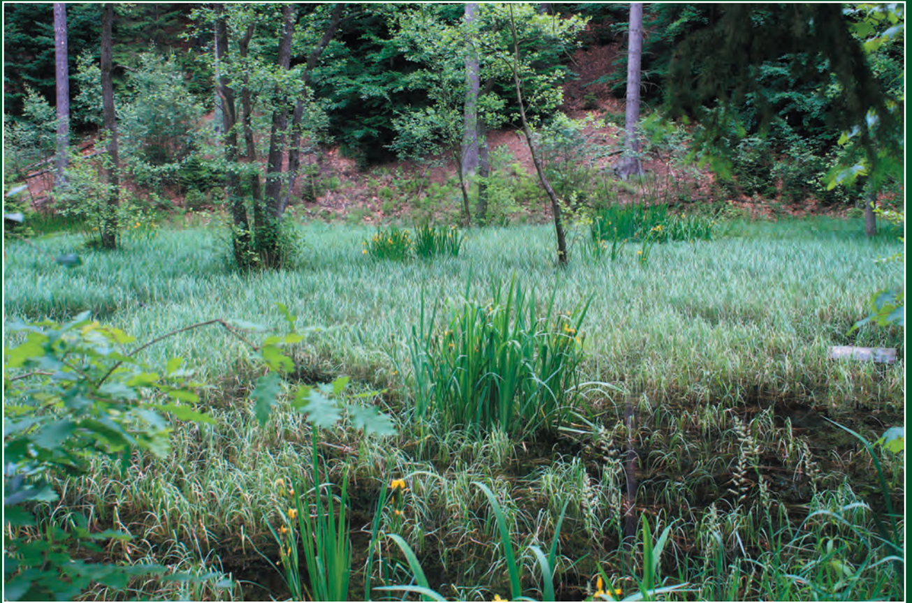
Gunter Zimmermann, Dresden: Spätfrühling im Waldmoor (Dresdner Heide)