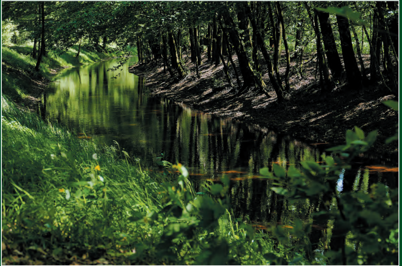
Sonja Walter, Dippoldiswalde: Grüne Waldoase (An der Schwarzen Elster)