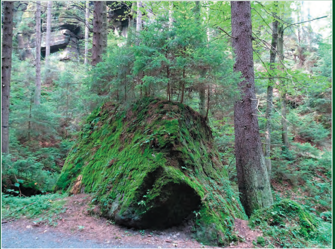
Karola Johné, Dresden: Anglerfisch versteinert (Sächsische Schweiz, Zschand)