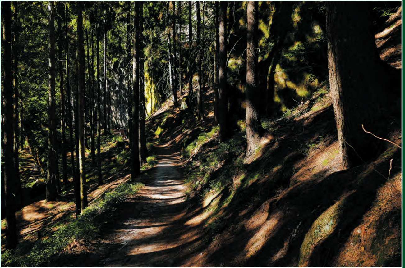
Sonja Walter, Dippoldiswalde: Märchenwald (Hinterhermsdorf, Weg zur Oberen Schleuse)